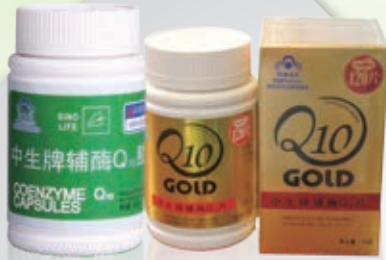
輔酶 Q 10 片 / 膠囊