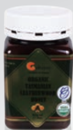
有機塔斯馬尼亞 灌木蜂蜜